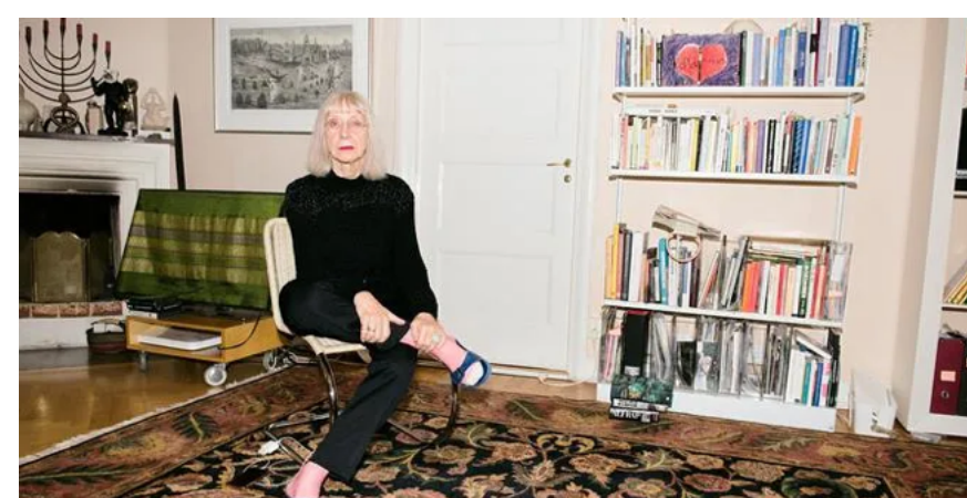
Suzanne Osten är död