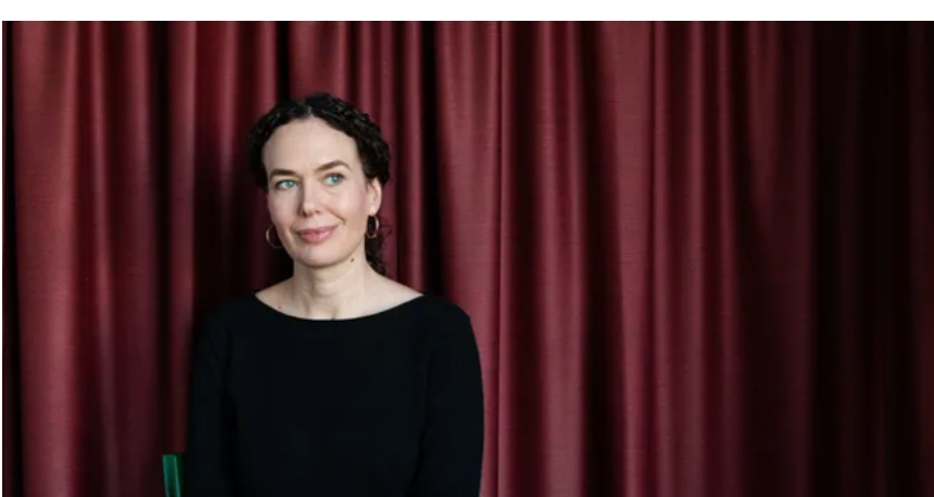
"Alla på alla kultursidor hade fel om allt"