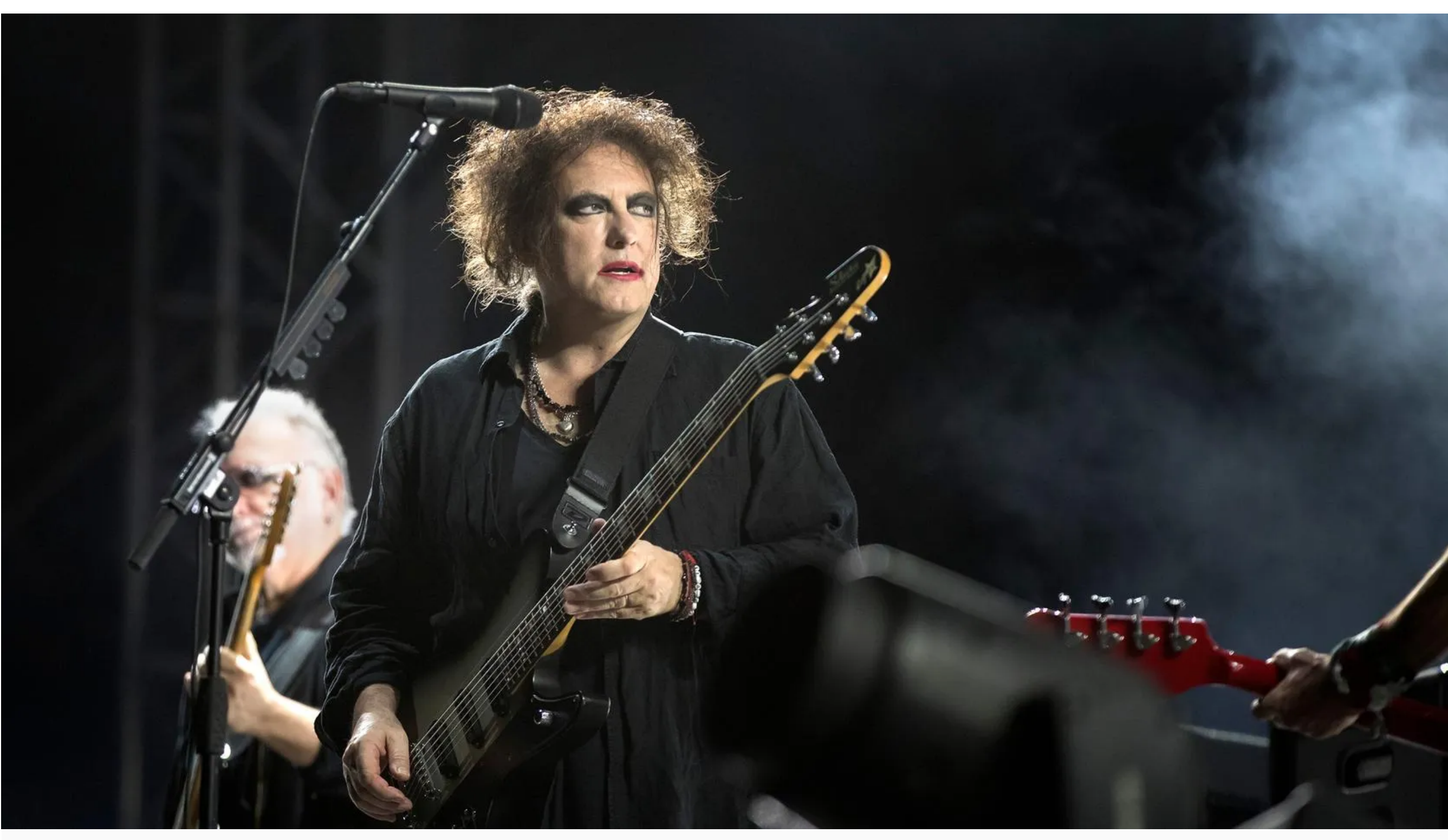
Robert Smiths röst diskuteras flitigt bland The Cure-fansen.

Publicerad 6 oktober (Uppdaterad 7 oktober)