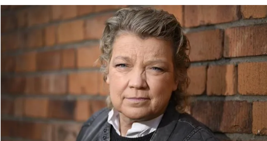
Fotografen Elisabeth Ohlson död